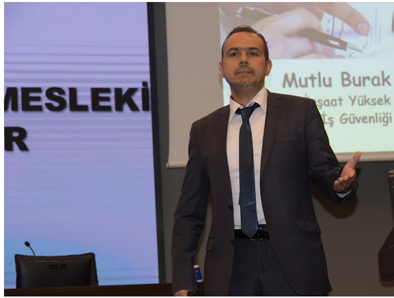
İnşaat Yüksek Mühendisi, A Sınıfı İş Güvenliği Uzmanı, İş Kazaları Adli Bilirkişisi

İşçi Sağlığı ve İş Güvenliği Meclisi verilerine göre geçen yıl 1923 çalışan iş kazalarında yaşamlarını yitirdi. Yaşamlarını yitirenler çalışanların 483'ü inşaat ve yol işkolunda çalışmaktaydı. Ölümlü iş kazalarının en çok yaşandığı sektör şantiyeler olup ölüm sebeplerinden yarısından fazlası yüksekte düşmedir.